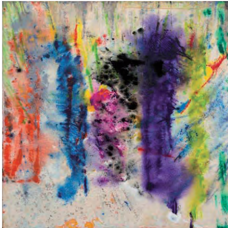
Take Stripes 2 | 2013, 40 x 40 cm