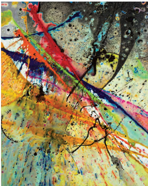
Glide | 2013, 100 x 80 cm