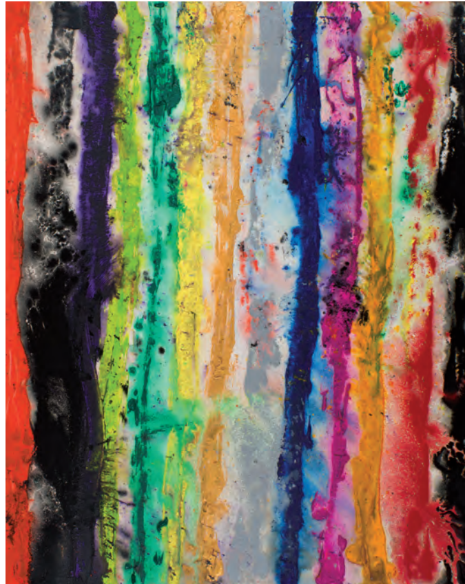
Motherboard Stripes | 2013, 110 x 90 cm