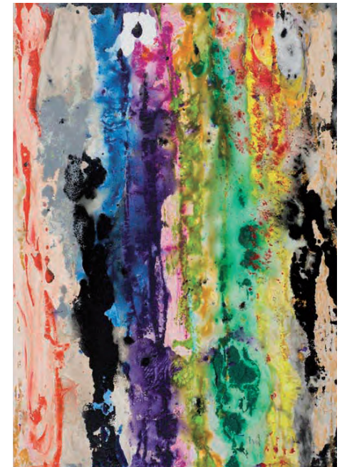
Take Stripes 1 | 2013, 65 x 45 cm

Detlef E. Aderhold's malerisches Gesamtwerk beeindruckt nicht nur durch seinen Umfang, sondern auch durch ein hohes Maß an Konsequenz, Reflexion und Intensität.